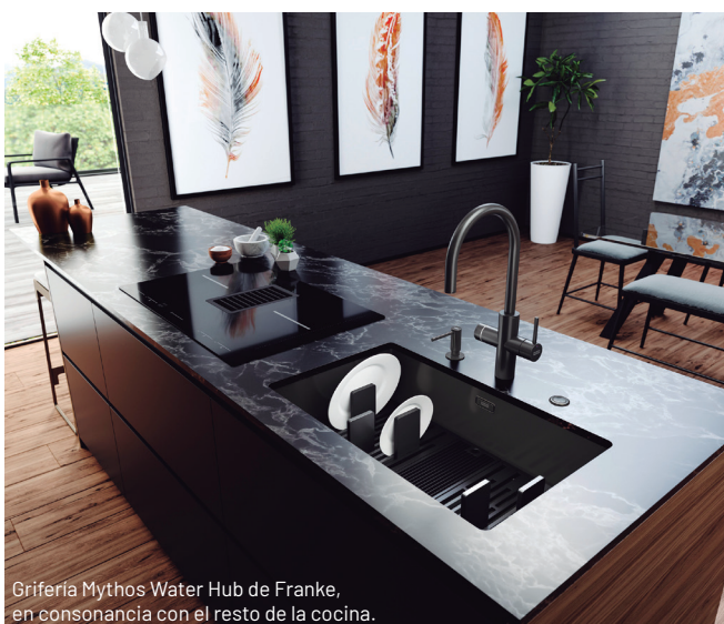
Grifería Mythos Water Hub de Franke, en consonancia con el resto de la cocina.

La grifería de cocina experimenta una severa transformación desde hace años, que se consolidará en 2026. El grifo ha dejado de ser un simple elemento funcional y constituye ahora un elemento de diseño imprescindible , así como un sistema tecnológico avanzado . Los principales fabricantes de grifería coinciden en que la innovación actual se apoya en ocho pilares, que fusionan estética, eficiencia y una funcionalidad real y tangible.