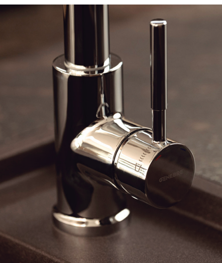
Sistema de 2 aguas en una misma aplicación, de Genebre.

La compañía cuenta con todos los recambios necesarios para esta referencia siempre en stock.