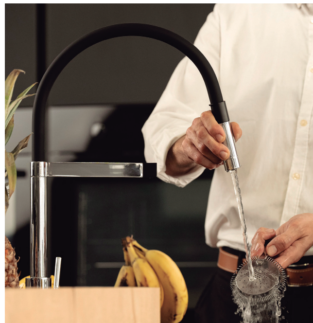
Caño flexible multidireccional, con duchita sujeta al grifo por fijación magnética.