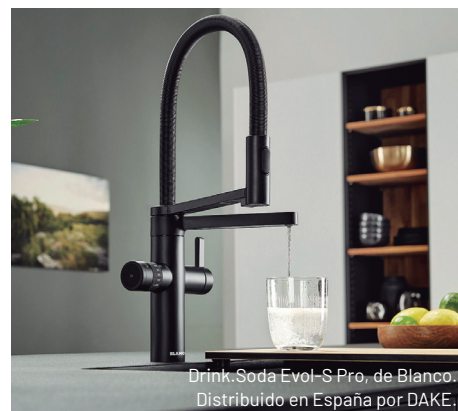
Drink.Soda Evol-S Pro, de Blanco. Distribuido en España por DAKE.

La tendencia principal es la multifuncionalidad . Modelos como el Drink. Soda Evol-S Pro integran en un único cuerpo agua fría, caliente, filtrada, refrigerada filtrada y con gas, respondiendo a un estilo de vida que prioriza confort, eficiencia y reducción de residuos plásticos. Esta integración optimiza el espacio y eleva la experiencia de uso en cocinas contemporáneas.