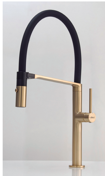
Modelo Nami, de Elleci.

La grifería contemporánea se redefine bajo tres macro tendencias: ergonomía, sostenibilidad y estética , transformando el fregadero en un centro operativo avanzado. En el plano funcional, el diseño evoluciona hacia una ergonomía de precisión con duchas extraíbles que optimizan los flujos de trabajo y la limpieza. La sostenibilidad se integra mediante la multifuncionalidad tecnológica. Sistemas como Elleci Pure incorporan microfiltración para reducir el consumo de plásticos, mientras que innovaciones técnicas permiten una gestión hídrica y energética responsable sin sacrificar la experiencia de uso. Finalmente, la vertiente estética apuesta por un lenguaje proyectual unitario. Los mezcladores dialogan con el entorno a través de acabados metálicos sofisticados o paletas cromáticas integradas.