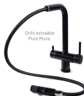
Grifo extraíble Pure Mura.

Pure Mura Grifería con salida para osmosis y ducha extraíble LTN, disponible en cromo brillo y negro mate. Ideal para espacios que priorizan la pureza del agua y la comodidad en su uso.