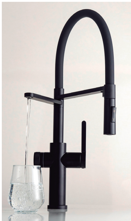
Modelo Ventum Pure, de Elleci.