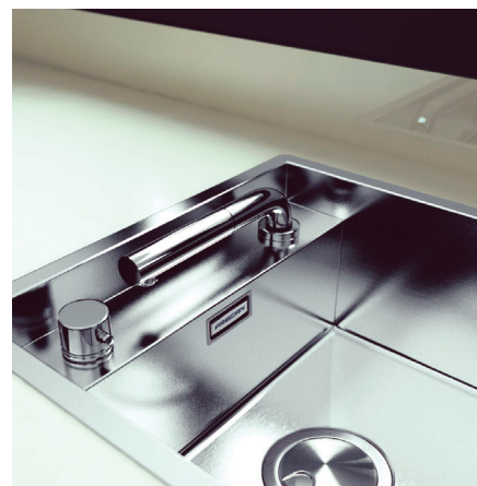
Latus + Up.

Este año, las tendencias en el diseño de grifería de cocina apuntan hacia formas en "L" y cuello de cisne, según explican desde Frecaan. En materiales y acabados, el PVD sigue siendo una apuesta segura.