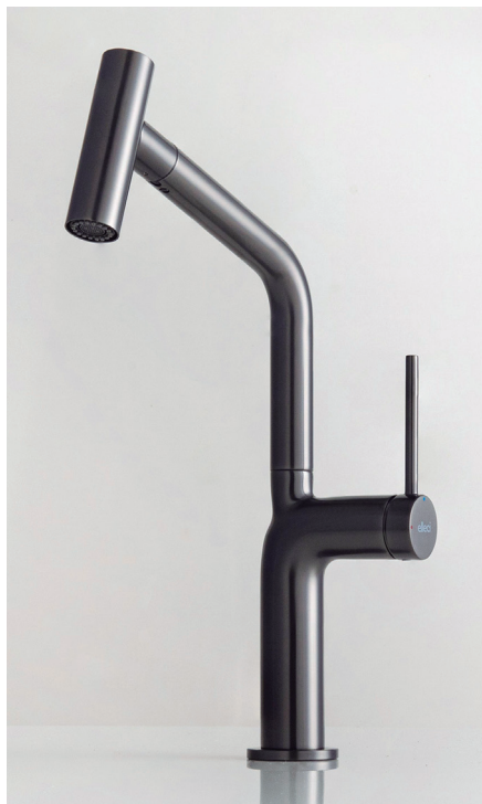
Modelo Loch, de Elleci.