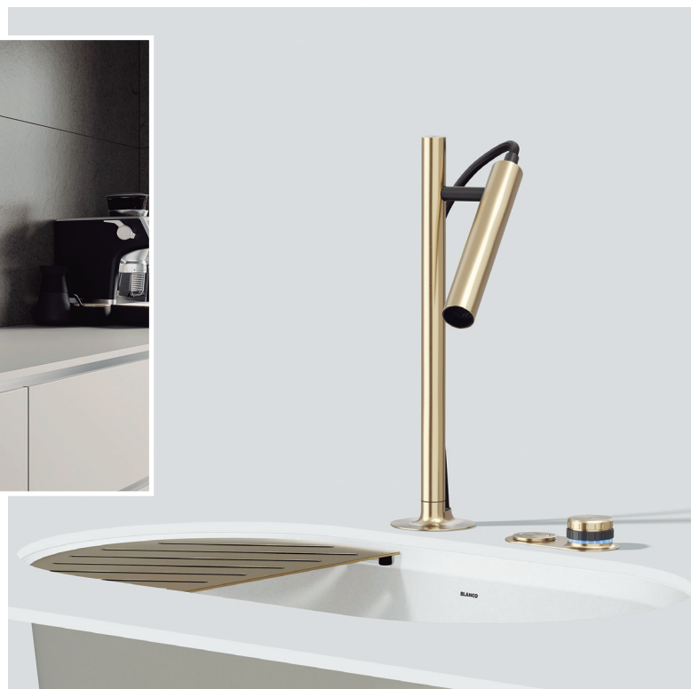
Blanco Luneoo, distribuido en España por DAKE.