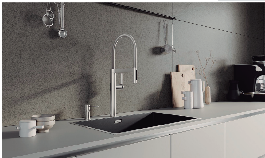
Culina-S II Sensor, de Blanco. Distribuido en España por DAKE.

En colaboración con estudios de cocina e interioristas, predominan soluciones que combinan altas prestaciones con una estética limpia y coherente con el conjunto del proyecto. El Fontas-S II es uno de los más demandados por integrar agua regular y filtrada en un único cuerpo con caño extraíble. El Culina-S II Sensor destaca en proyectos de enfoque tecnológico o semiprofesional. En cocinas de alta gama, el Drink.Soda Evol-S Pro gana protagonismo por su carácter versátil. Finalmente, la novedad del año de Blanco es Luneoo , que destaca por sus líneas estilizadas, caño extraíble y acabados premium .