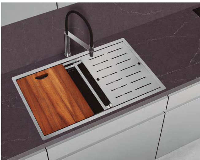
La funcionalidad se combina con la estética. Propuesta de Frecan.

varias marcas siguen confiando plenamente en el acero inoxidable. Desde Franke, apuntan a la necesidad de escoger los materiales en consonancia con la estética general de la cocina, primando por supuesto la funcionalidad.