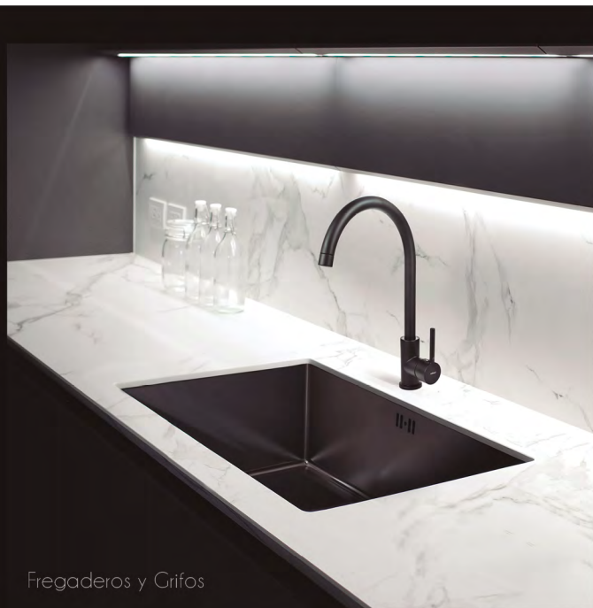
Fregaderos y Grifos